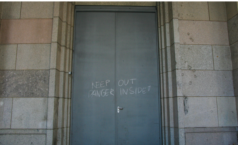
Oben: Ausblick aus dem Dokuzentrum auf den gläsernen »Pfahl« oberhalb des Haupteingangs; Mitte: Spuren eines entfernten Reichsadlers (siehe S. 93); unten: Graffito an einer Tür an der Außenwand der Kongresshalle